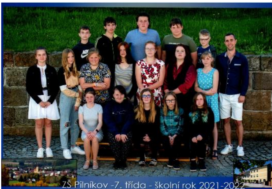
ZŠ Pilníkov -7. třída - školní rok 2021-2022