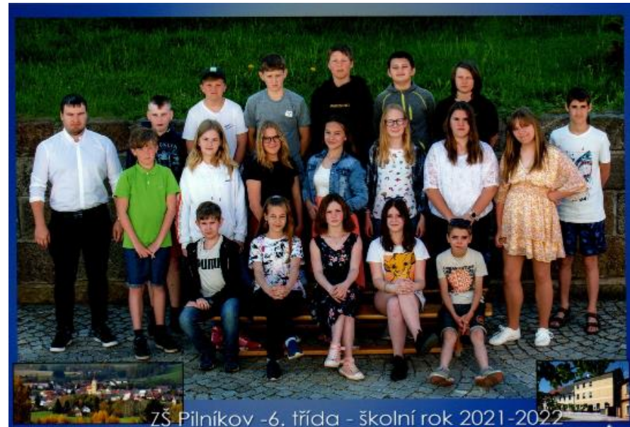
ZŠ Pilníkov -6. třída - školní rok 2021-2022