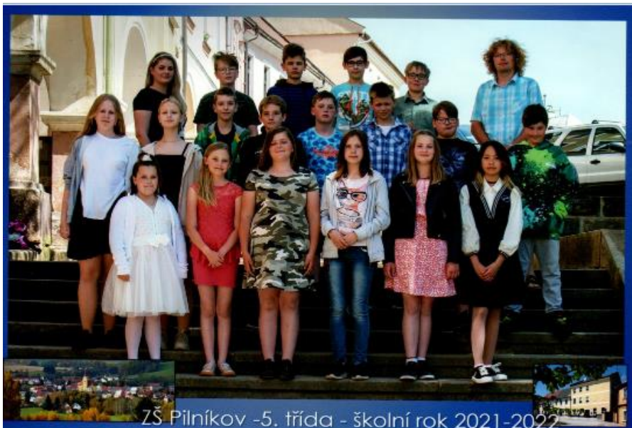
ZŠ Pilníkov -5. třída - školní rok 2021-2022