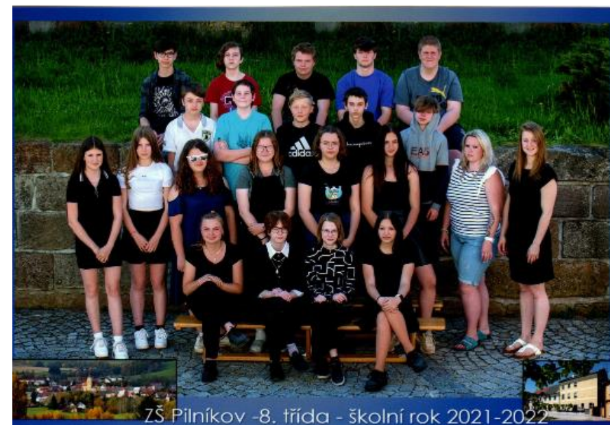
ZŠ Pilníkov -8. třída - školní rok 2021-2022